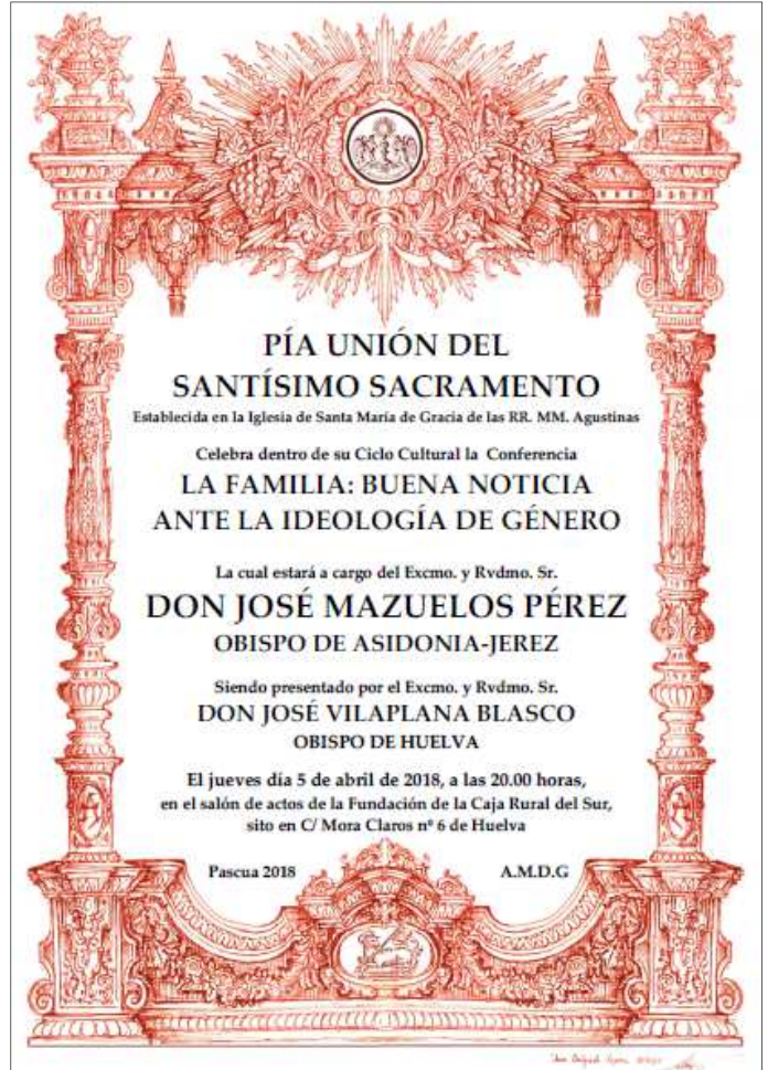
Convocatoria del acto